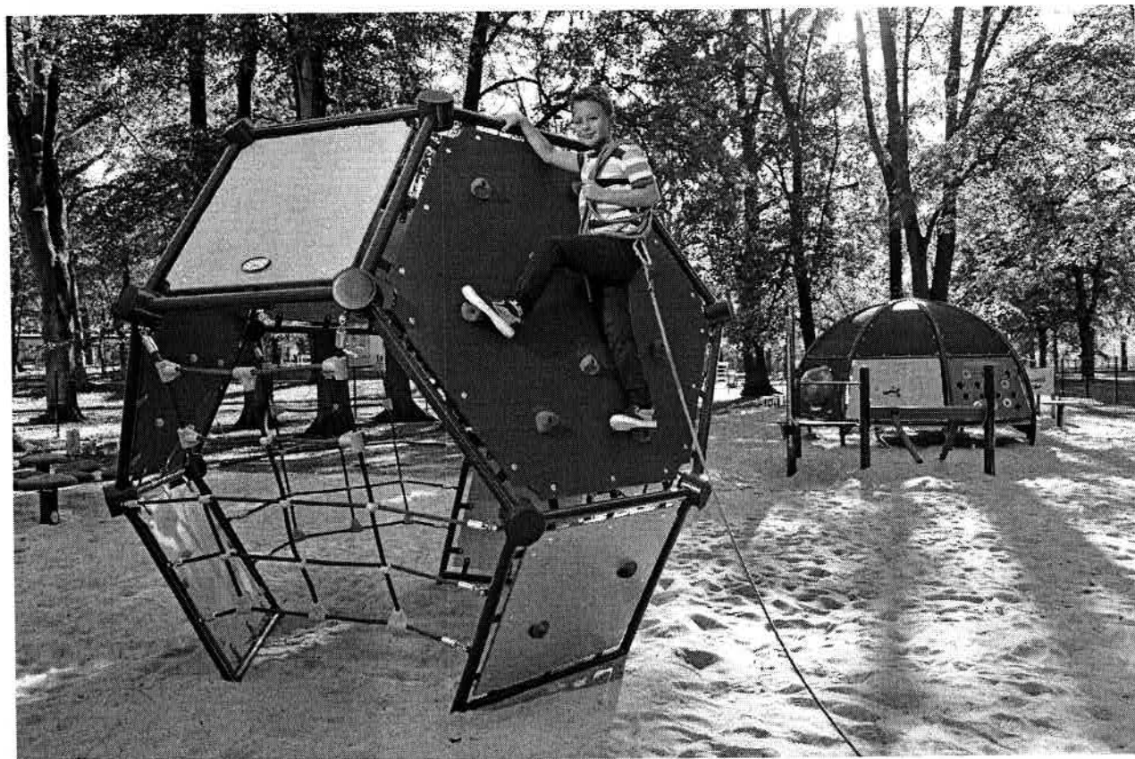
— NIVEA PLAC ZABAW0330.jpg